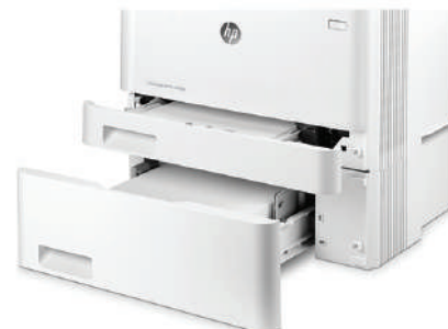
HP LaserJet Pro M452dn con bandeja de 550 hojas opcional