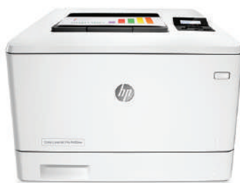
HP LaserJet Pro M452dn

Un rendimiento ideal de impresión y seguridad sólida para su forma de trabajar. Esta impresora en color compatible acaba los trabajos más rápido y ofrece amplia seguridad para la protección contra las amenazas. 1 Los cartuchos de tóner original HP con JetIntelligence producen más páginas. 2