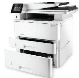
MFP (producto multifunción) HP LaserJet Pro M426fdw con bandeja de entrada de 550 hojas opcional