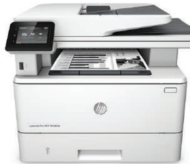
MFP (producto multifunción) HP LaserJet Pro M426fdn

Impresión, escaneo, copia y rendimiento de fax rápidos, además de seguridad sólida y amplia para su forma de trabajar. Este MFP (producto multifunción) termina las tareas clave más rápidamente y lo protege contra las amenazas. 1 Los cartuchos de tóner original HP con JetIntelligence le ofrecen más páginas. 2